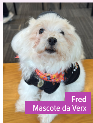
Fred Mascote da Verx

Além dos benefícios estruturais, o modelo amplia oportunidades de networking, colaboração e troca entre empresas.