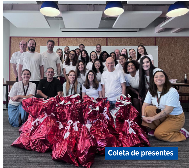
Coleta de presentes

Essas iniciativas reforçam a importância do apoio contínuo a projetos que promovem transformação social, inclusão e cuidado com as pessoas. Mais do que contribuições pontuais, representam um compromisso alinhado aos valores da Verx e à forma como entendemos nosso papel na sociedade