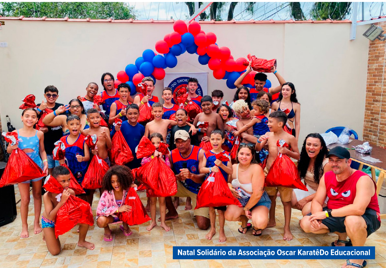
Natal Solidário da Associação Oscar KaratêDo Educacional