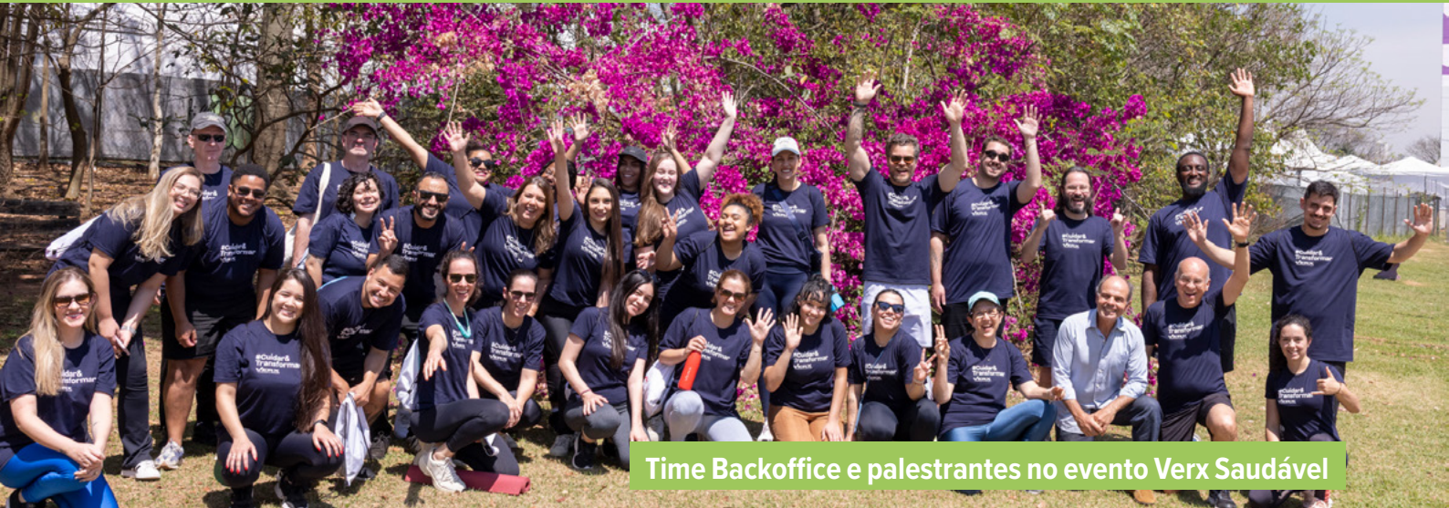
Time Backoffice e palestrantes no evento Verx Saudável