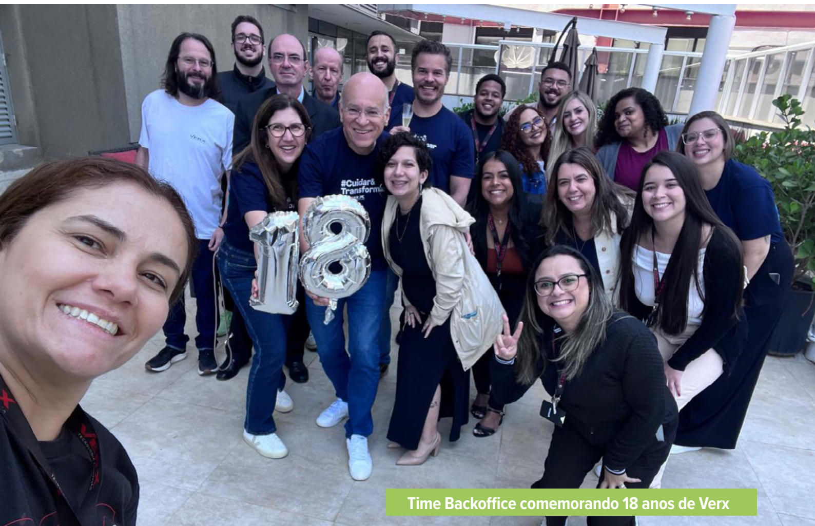
Time Backoffice comemorando 18 anos de Verx

No ano em que a Verx completou 18 anos, a empresa avançou na estruturação da Governança Corporativa, reforçando seu compromisso com uma gestão sólida, transparente e orientada ao futuro.