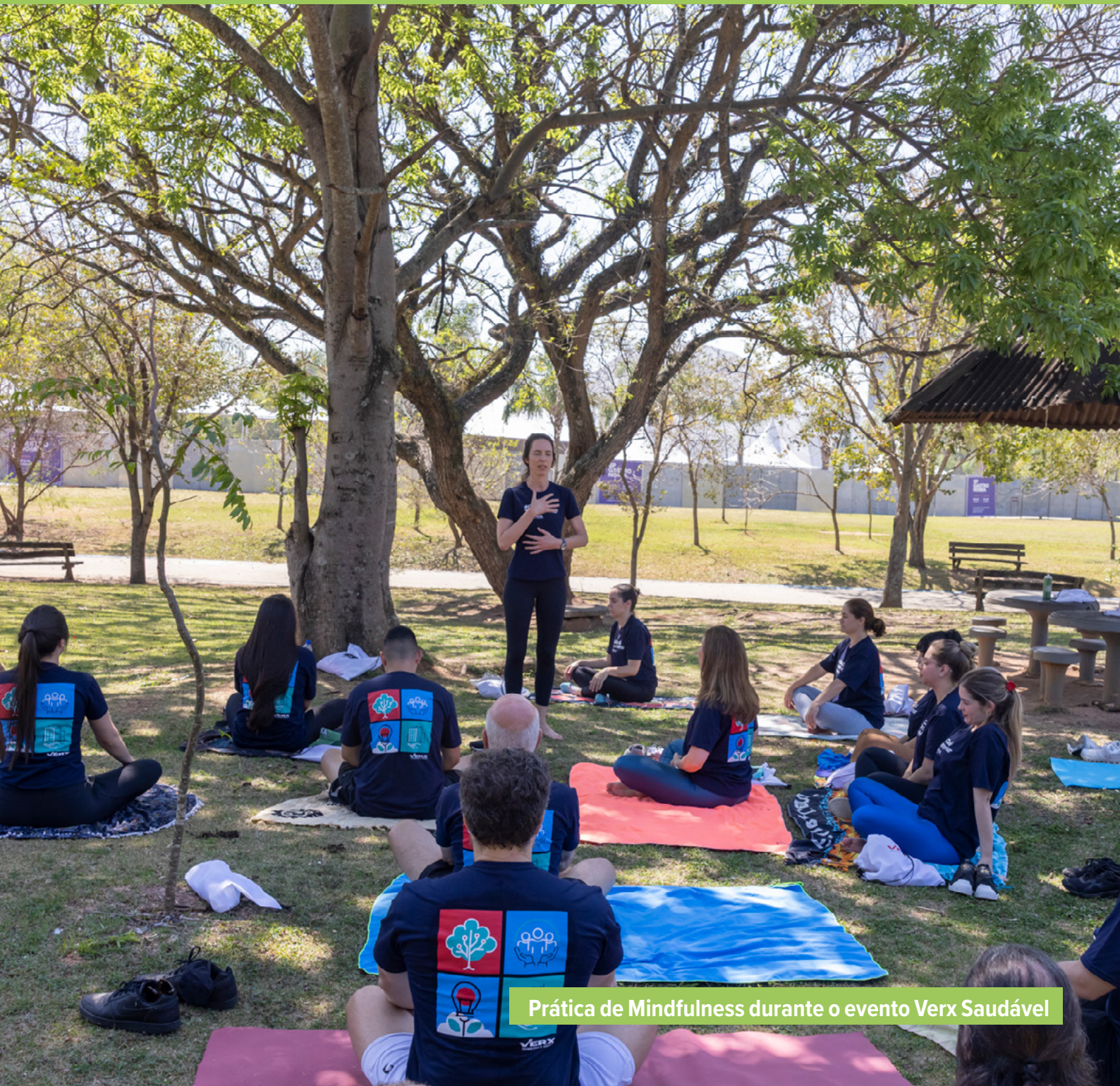
Prática de Mindfulness durante o evento Verx Saudável